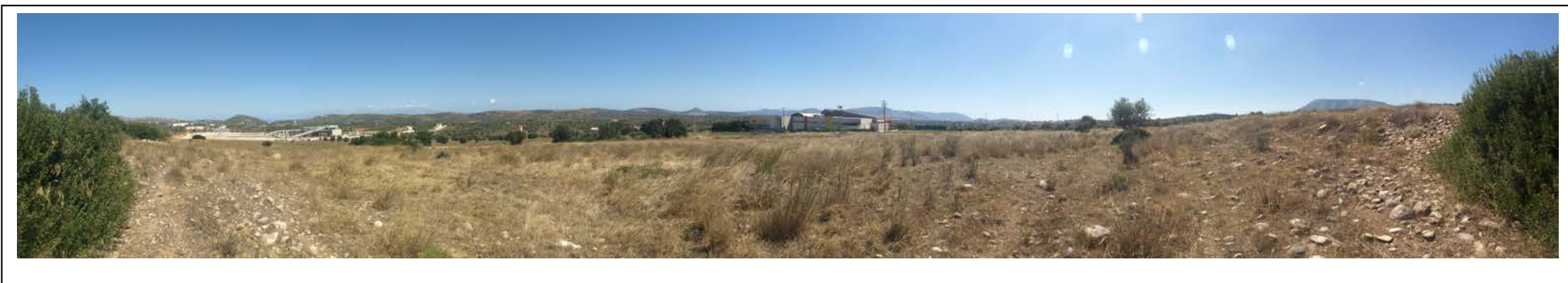
ΘΕΣΗ 8 Βορειοδυτική όψη του οικοπέδου (2)