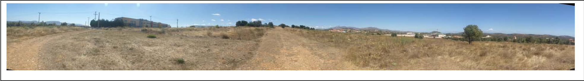
ΘΕΣΗ 3 Νοτιοανατολική όψη του οικοπέδου (1)