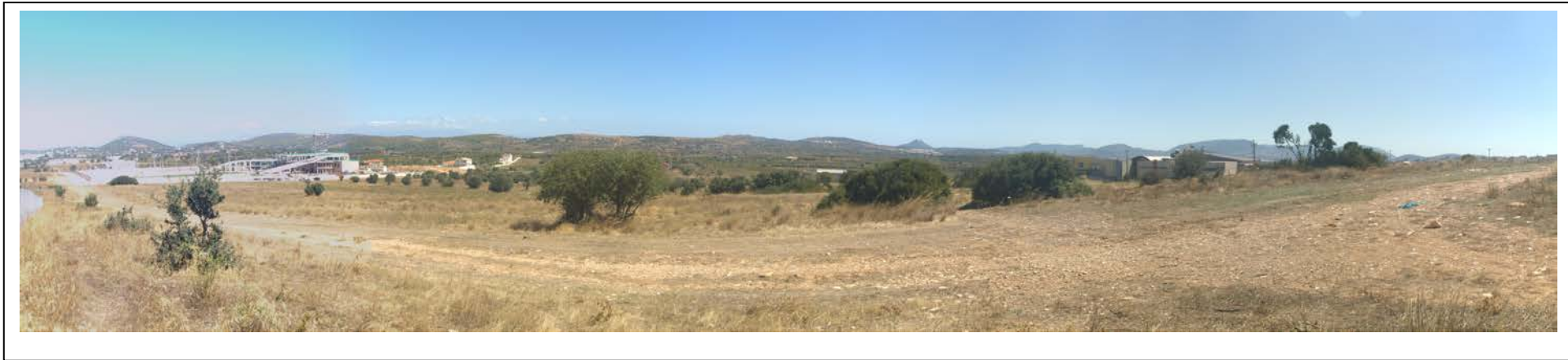
ΘΕΣΗ 1 Βορειοδυτική όψη του οικοπέδου (1) και οικοπέδου (2)