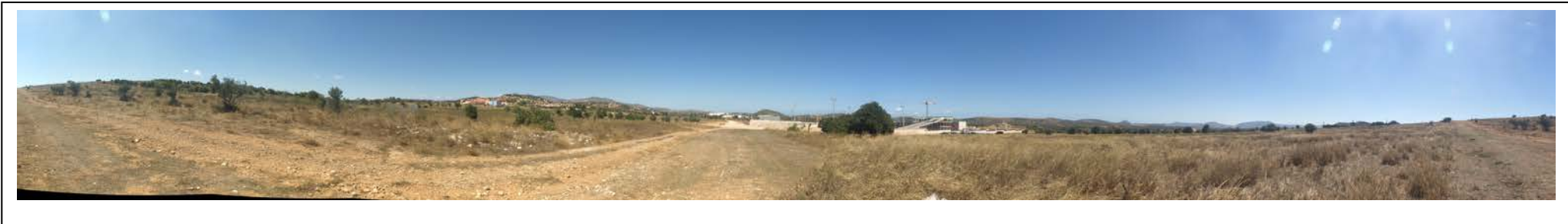
ΘΕΣΗ 7 Βορειοδυτική όψη του οικοπέδου (1)