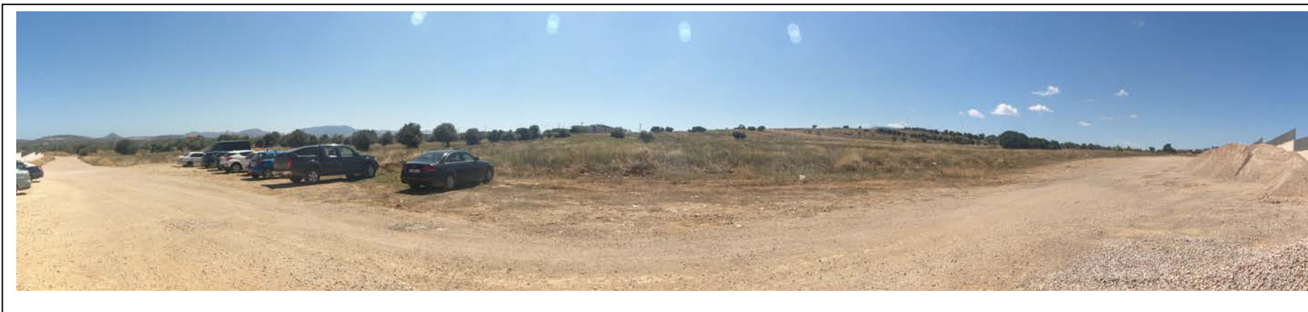
ΘΕΣΗ 6 Βορειοανατολική όψη του οικοπέδου (1)