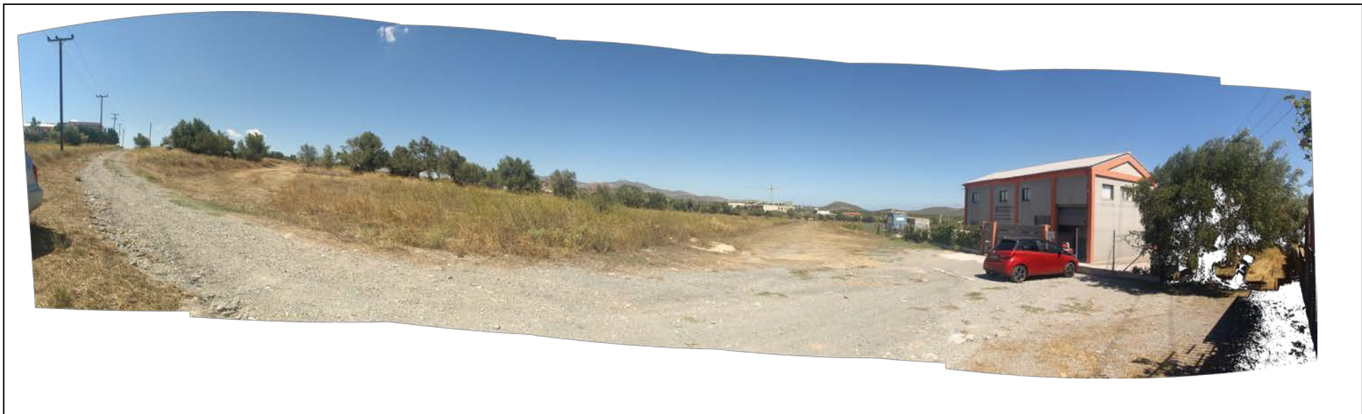
ΘΕΣΗ 4 Νοτιοανατολική όψη του οικοπέδου (1) και του οικοπέδου (2)