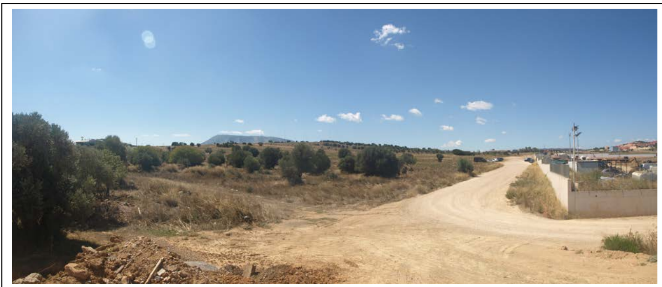
ΘΕΣΗ 5 Βορειοανατολική όψη του οικοπέδου (1)