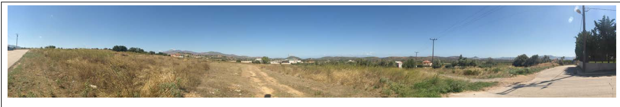
ΘΕΣΗ 9 Νότια όψη του οικοπέδου (1) και του οικοπέδου (2)