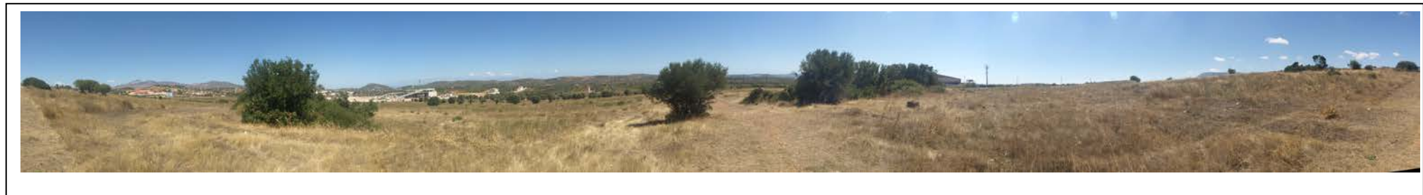
ΘΕΣΗ 2 Νοτιοδυτική όψη του οικοπέδου (1)